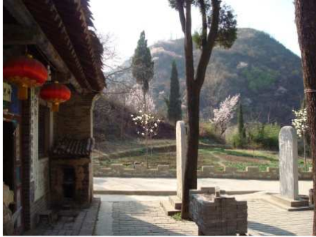
Anlegong im Frühling.

Wir waren genau zu der Zeit der Kirschblüte in den Bergen, was immer wieder ein Erlebnis ist.