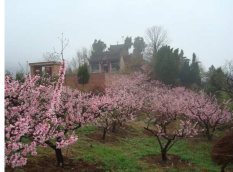
Die Halle der Drei Reinen, umrahmt mit einer Blütenpracht.